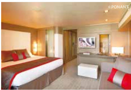
客室にも赤が差し色で使われている。トイレとシャワーが分かれているのも日本人にはうれしい

一方で船内に戻ると、ポナンの客船ならではのスタイリッシュなインテリアと、至極の美食の数々が乗客を待っている。センスの良い船内は、冒険の旅を彩りつつも過度に飾らず、乗っているほどにしつくりとくる心地よさだ。 ポナンでの南極クルーズの乗客定員は200人以下に抑えられているので、上陸を待つ時間は決して長くない。一方で100人以下の客船に比べて、パブリックスペースなどに圧迫感はない。講座なども落ち着いて話を聞ける空間となっている。全船、全航路、インターネットが無料のため、情報収集やSNSへの投稿などもしやすいのがうれしい。