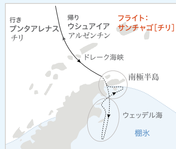
■ ル・コマンダン・シャルコー

南極半島の東、氷に包まれた秘境、ウエッデル海を目指します。ここには世界最大のペンギンである皇帝ペンギンが生息します。冬から春へと移り変わるこの季節、若い皇帝ペンギンたちが泳ぎ方を学ぶ様子など、貴重な姿を見ることができません。船で営業地へアプローチできるのはル・コマンダン・シャルコーだけです。想像を超えるほどの大自然の奥深くへ、冒険の旅に出かけましょう。