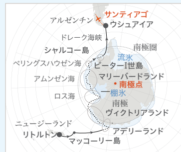
■ ル・コマンダン・シャルコー

ニュージーランドからチリまで、南極大陸の半周航に出発します。南極最大の棚氷に覆われたロス海をも航行するこの大冒険を可能にするのは、世界初の液化天然ガス(LNG)とバッテリーのハイブリッド砕氷船「ル・コマンダン・シャルコー」。「テラ・ヌリウス」(ラテン語で「誰のものでもない土地」の意)への旅は、私たちの感覚をさらに研ぎ澄ましてくれることでしょう。