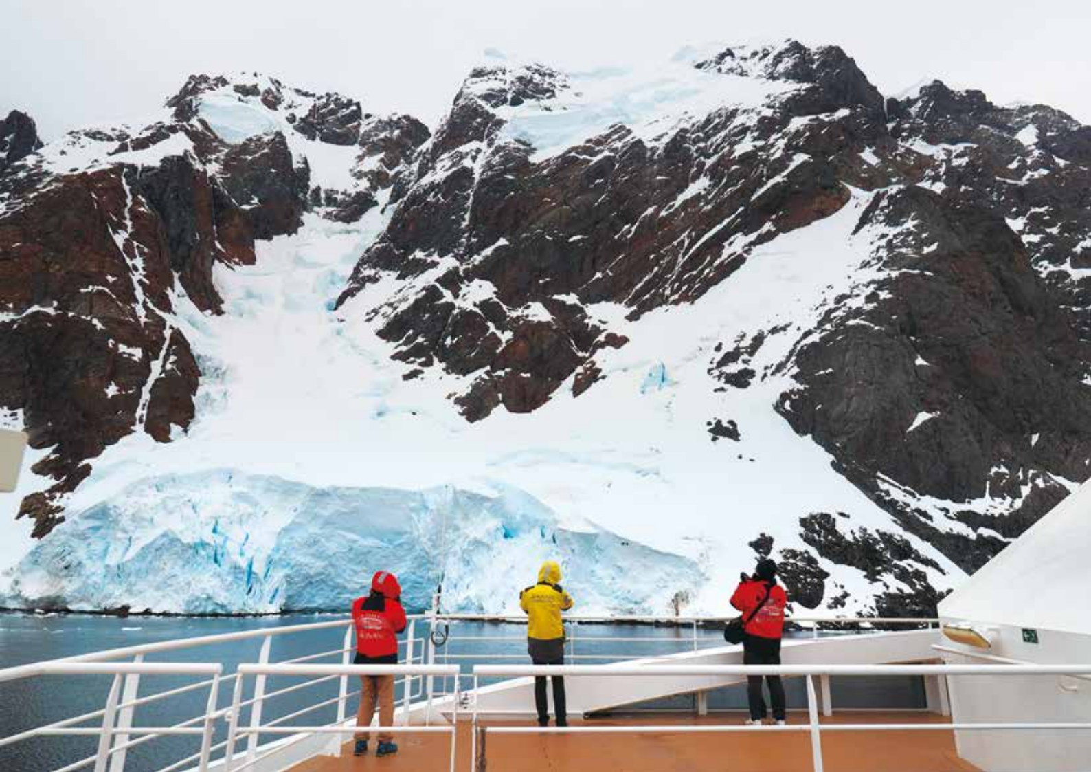
ルメル海峡の両岸には茶色の崖がそびえる。南極では誰もがシャッターを切りたくなる絶景に次々と出会う