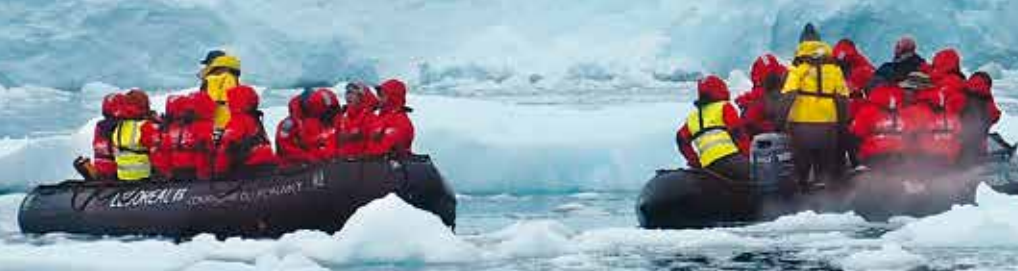
南極に到達すると、ゾディアック(エンジン付きゴムボート)に乗って、氷の世界に繰り出す。赤いパーカーや長靴は、ポナンの用意してくれる。黄色いジャケットを着ているのが、エクスペディション・スタッフ(専門家)たち