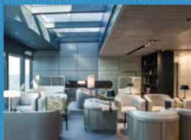
左:アトリウムのLEDには、自然をモチーフにしたデジタルアートを投影 右上:厚さ2メートル程度の氷を砕いて航行。船が通ったあとは氷は元に戻ります 右下:大きな窓から南極の雄大な風景を眺められるラウンジ