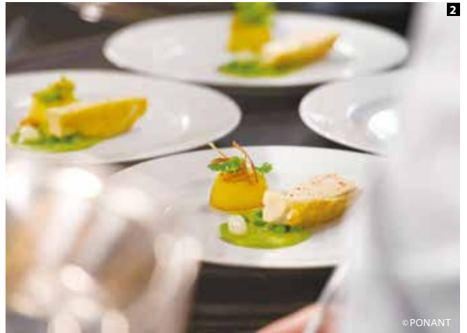
1 極地クルーズでは「今日はどうだった？」など、ダイニングでの会話も弾む 2 見た目も美しいのが、ポナンの料理の特長でもある 3 ライブラリーを兼ねたスペースでは、南極に関する本を眺めたい 4 落ち着きあるラウンジは「憩いの場」。乗客同士が顔見知りになれるコンパクトなサイズもいい