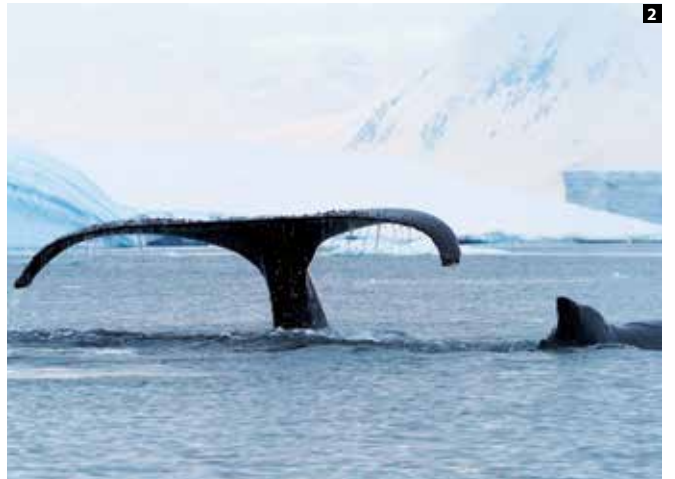
1 ウェッデルアザラシののんびりとした昼寝姿が愛くるしい 2 ザトウクジラは地球上の動物の中で最大級。パブルネットフィーディングという独特の狩りを行う群れに遭遇することもある 3 ペンギンは5メートル、アザラシは10メートル、それぞれ人間が動物との距離を保つための目安。南極上陸では環境にも配慮したい 4 ペンギンの中では最も個体数が多いヒゲペンギン。喉を通る帯模様が名前の由来