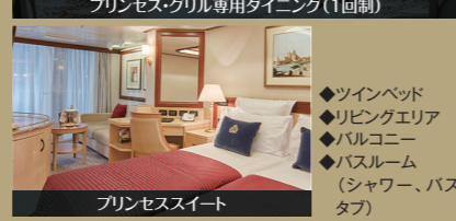
プリンセススイート