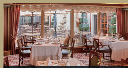
プリンセス・グリル専用ダイニング(1回制)