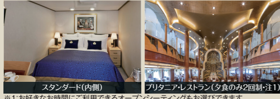
スタンダード(内側)