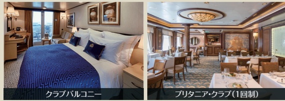
クラブバルコニー