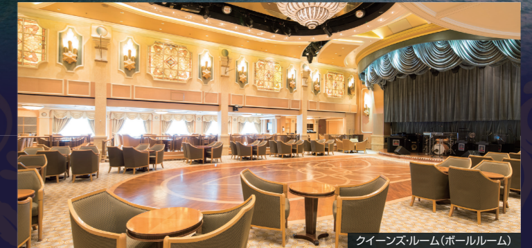
クイーンズ・ルーム(ボールルーム)