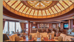
グリルズ・ラウンジ

キューナードでは、2つの専用ダイニングである「クイーンズ・グリル」と「プリンセス・グリル」を利用するカテゴリーを「グリルクラス」と称しています。グリルクラスだけのサービスや専用エリアでより快適な船内生活をお過ごしください。