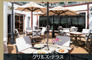
グリルズ・テラス