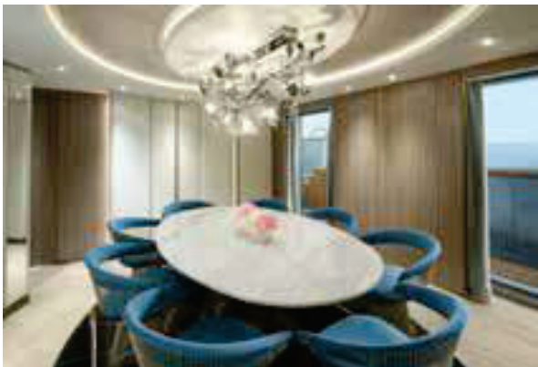
オーナーズレジデンス：全1室 部屋の広さ：280㎡、バトラーサービス付き。

2025年5月21日(水)~26日(月)の FORMULA 1 モナコグランプリ2025 の大会期間中、エクスプローラ ジャーニーの最新船、 エクスプローラII がモナコ、エルキュール港に停泊し、ご乗船のお客様に、伝統の一戦を間近で観戦するまたとない機会をご提供します。 エクスプローラ ジャーニーは2023年、MSCグループから新たに誕生したラグジュアリー客船ブランドです。オールインクルーシブのサービス、陽光あふれる明るい船内、4か所のプール、全室オーシャンフロントのテラス付きスイート、5か所の無料レストランを含む豊富なお食事と飲み物のチョイスなど、最上級のくつろぎをお約束する船旅で、お客様にOCEAN STATE OF MIND（海とのつながり）をお届けしています。