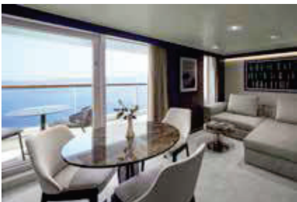
オーシャンペントハウス：全67室 部屋の広さ：43-68㎡、ダイニングテーブル付き。