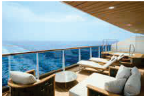
オーシャンレジデンス：全22室 部屋の広さ：70-149㎡、バトラーサービス付き。