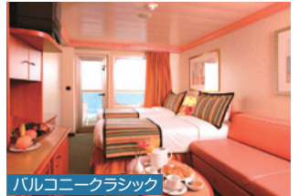
バルコニークラシック