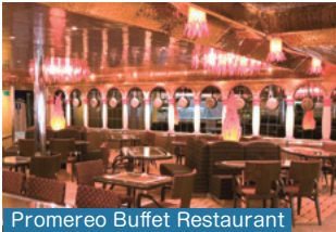
Promereo Buffet Restaurant