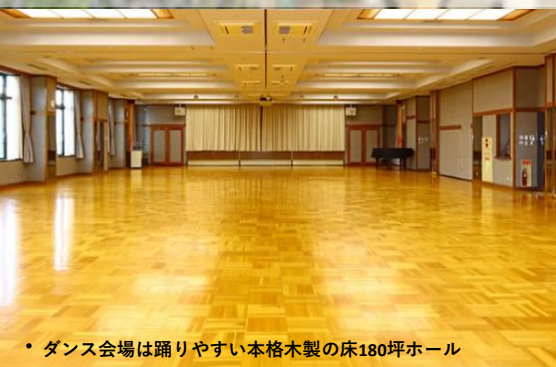
・ダンス会場は踊りやすい本格木製の床180坪ホール