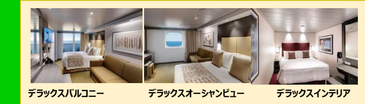
デラックスバルコニー